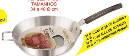
IMAGEM PARA TAMANHOS 34 a 40 Ø cm

FRIGIDEIRA HOTEL MAXXI GOURMET C/ CABO DE BAQUELITE (FOSCA)