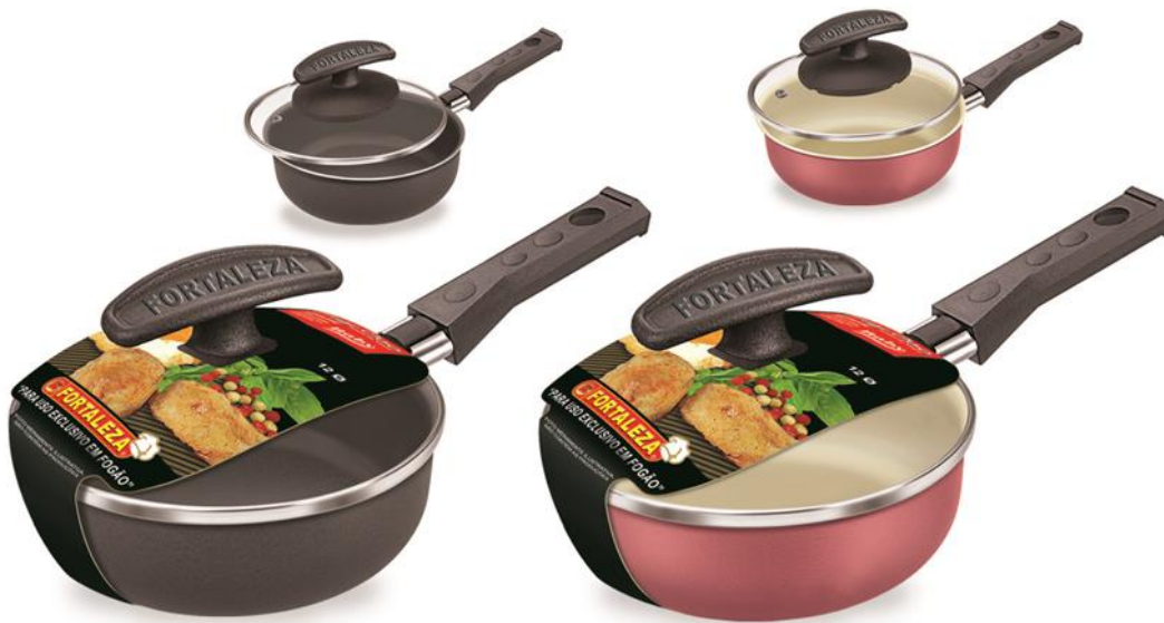
FRIGI-OVO 12 Ø C/ TAMPa DE VIDRO (ARTISTIC) SARTÉN P/ HUEVO 12 Ø C/ TAPA DE VIDRIO (ARTISTIC) (ARTISTIC) EGG FRYING PAN 12 Ø WITH GLASS COVER

885600 7896554501765 8 24 PEÇAS 238x170x285 1.852 2.020 255x137x30