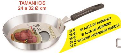
IMAGEM PARA TAMANHOS 24 a 32 Ø cm