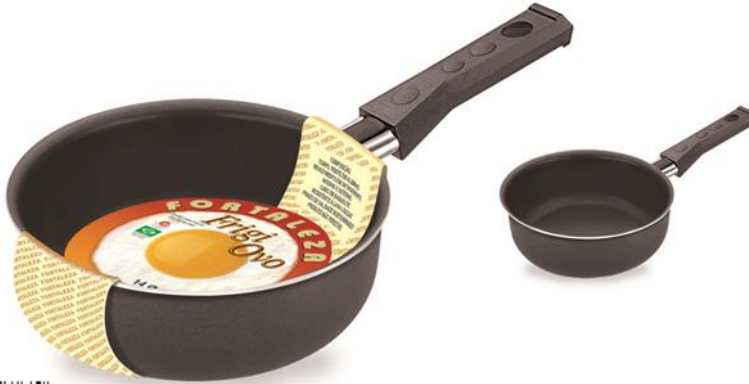
FRIGI-OVO 14 Ø (BLACK) SARTÉN PARA HUEVO 14 Ø (BLACK) (BLACK) EGG FRYING PAN

Natureza da certificação: Segurança N. Registro: 004864/2020 Avaliado pelo OCP-0134 Certificação compulsória Classificação de antiaderente A=Ótima