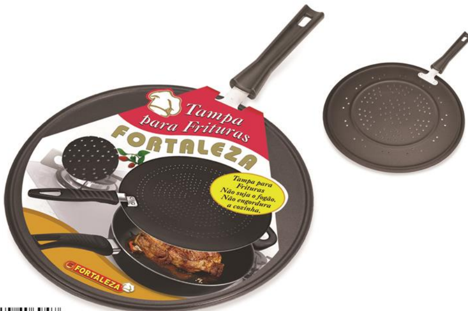
TAMPA PARA FRITURAS 26 Ø (BLACK) TAPA PARA FRITURAS 26 Ø (BLACK) (BLACK) FRYING PAN COVER 26 Ø

CEREJA 749956 7896554413679 4 12 PEÇAS 542x280x210 3.096 3.618 250x136x100